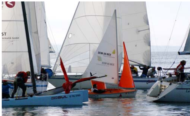
Mittendrin statt nur dabei. Ein Access Dinghy 303 von Sailability.ch mit Innenposition an der Leeboje während der 13. Mondscheinwoche.

Bereits letztes Jahr konnte es passieren, dass auf einmal ein kleines Boot mit farbigem Segel auftauchte - dann war es ein Boot von Sailability.ch. Sailability.ch ist ein Verein, der sich zum Ziel gesetzt hat, das Leben von Menschen mit besonderen Bedürfnissen, durch Segeln zu bereichern. Auch dieses Jahr werden wieder vier Boote starten. Das wöchentliche Mittwochstraining dieser Jugendlichen und Erwachsenen mit besonderen Bedürfnissen betreut seit Anfang