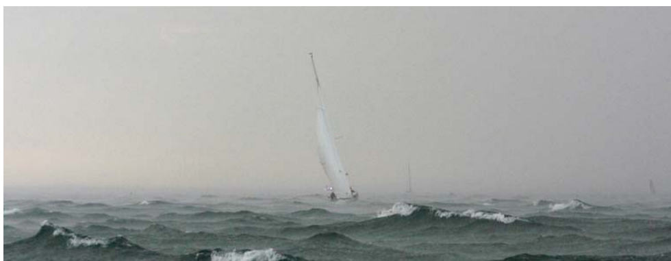
Schlechtwetterstimmung am Bodensee

hältnissen einstellen, liegen voraussichtlich richtig. Es ist heute Abend mit Regen zu rechnen. Aber wie heisst es doch so schön: „Segler kennen kein schlechtes Wetter, nur falsche Bekleidung!“