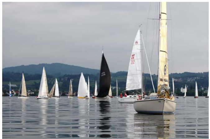
Warten auf den fehlenden Wind zum Auftakt der 15. Mondscheinwoche

Einen Abend an der „Jubiläumsregatta“, bei dem die sportliche Seite etwas zu kurz kam, lädt ein, einige Gedanken zu der traditionellen Veranstaltung zu tun. 15 Jahre